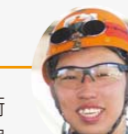
機械工事部製缶係 平成29年入社

広大な製鉄所の色々な所で作業しますので、沢山の技術が自分の身につく職場です。機械を触ったり、物作りに興味のある方は是非ご応募ください。